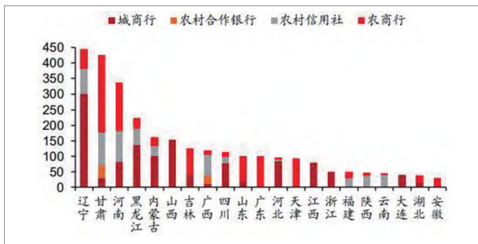
图2 20个省份发行中小银行专项债补充资本金详图 (2020.07-2022.03) ⑩

其次是要对银行快速成长阶段产生的各种新兴金融工具进行严格管控。为了协助金融体系规模实现迅速扩张，各大金融机构开始使用全新的金融工具，同业存单就是其中一种。它的发行确实为诸多银行解决了发展资金临时短缺问题，但也出现了资金“滥用”的问题。以广州银行为例，在相关机构对该行的评级报告和此前广州银行的上市招股书均显示，该行金融资产和金融负债现金流结构存在期限错配，从而给业务增长和资产盈利能力带来了一定的挑战。